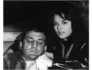
1962 CARMEN 63 (Carmen di Trastevere) de Carmine Gallone avec Giovanna Ralli