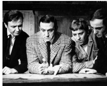
1965 LA MÉTAMORPHOSE DES CLOPORTES de Pierre Granier-Deferre avec M. Biraud, G. Gêret, Ch. Aznavour