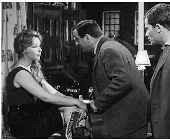
1960 LA FILLE DANS LA VITRINE (La Ragazza in vetrina) de L. Emmer avec M. Vlado, B. Fresson