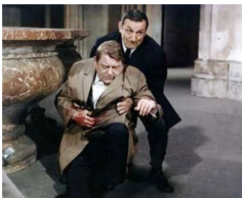
1966 AVEC LA PEAU DES AUTRES de Jacques Deray avec Jean Servais