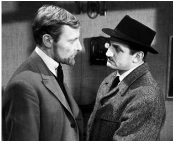
1958 MONTPARNASSE 19 de Jacques Becker avec Gérard Séty