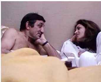
1973 LA BONNE ANNÉE de Claude Lelouch avec Françoise Fabian