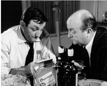
1963 LES TONTONS FLINGUEURS de Georges Lautner avec Bernard Blier