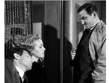
1958 ASCENSEUR POUR L'ÉCHAFAUD de Louis Malle avec Félix Marten, Jeanne Moreau