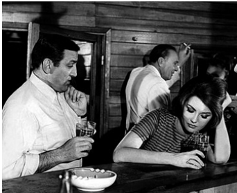
1964 L'ARME À GAUCHE de Claude Sautet avec Sylva Koscina