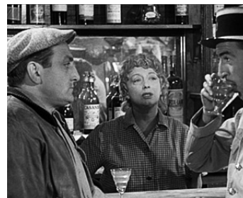
1959 DOUZE HEURES D'HORLOGE de Geza von Radvanyi avec Suzy Prim, Guy Tréjean