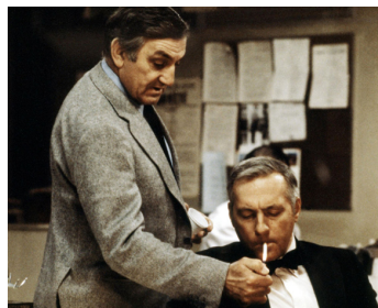
1981 GARDE À VUE de Claude Miller avec Michel Serrault