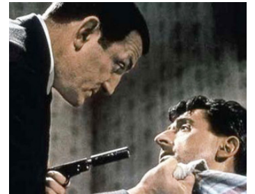
1965 NE NOUS FÂCHONS PAS de Georges Lautner avec Jean Lefebvre