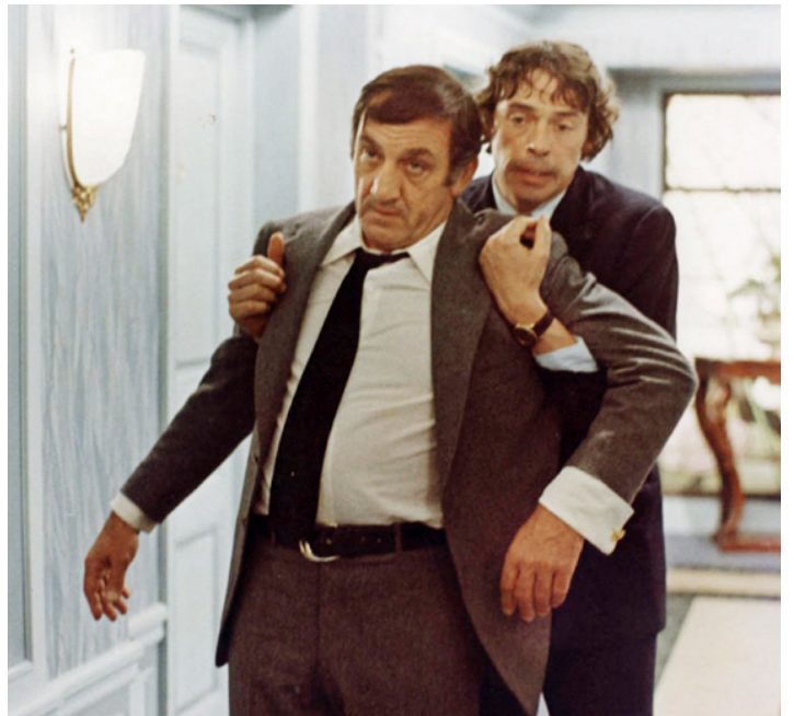
1973 L'EMMERDEUR d'Édouard Molinaro avec Jacques Brel