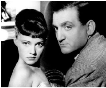
1953 TOUCHEZ PAS AU GRISBI de Jacques Becker avec Jeanne Moreau