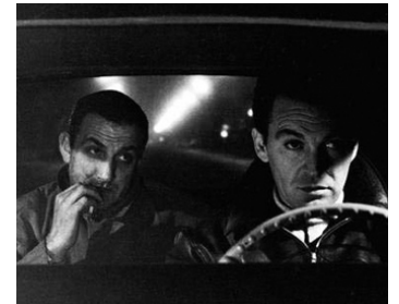
1958 UN TÉMOIN DANS LA VILLE d'Édouard Molinaro avec Franco Fabrizi