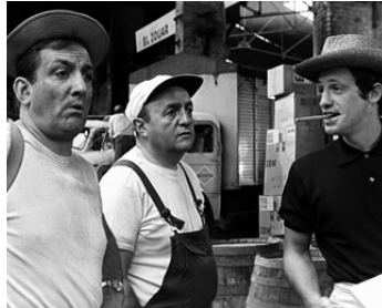
1963 CENT MILLE DOLLARS AU SOLEIL d'Henri Verneuil avec Bernard Blier, Jean-Paul Belmondo