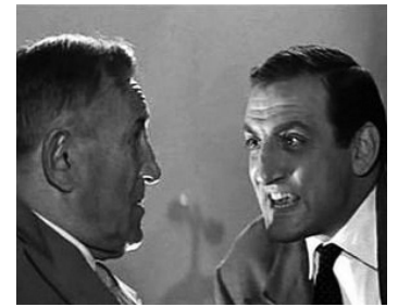
1956 LE FEU AUX POUDRES d'Henri Decoin avec Charles Vanel