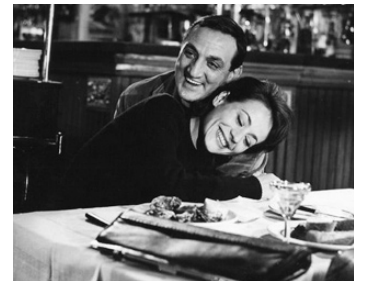
1961 LE BATEAU D'ÉMILE de Denys de La Pâtellière avec Annie Girardot