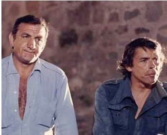
1972 L'AVENTURE, C'EST L'AVENTURE de Claude Lelouch avec Jacques Brel