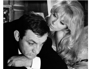
1964 LES BARBOUZES de Georges Lautner avec Mireille Darc