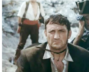
1963 LES BANDITS (Llanto por un Bandido) de Carlos Saura