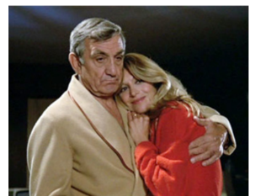
1984 LA SEPTIÈME CIBLE de Claude Pinoteau avec Béatrice Agenin