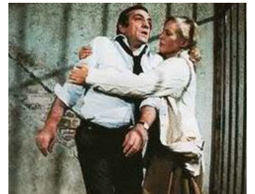
1975 LA CAGE de Pierre Granier-Deferre avec Ingrid Thulin