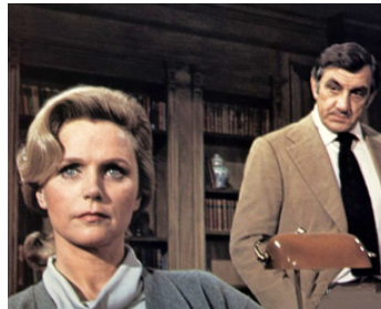
1977 LA GRANDE MENACE (The Medusa Touch) de Jack Gold avec Lee Remick