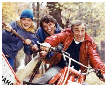
1983 LE RUFFIAN de José Giovanni avec Beatrix Van Till, Bernard Giraudeau