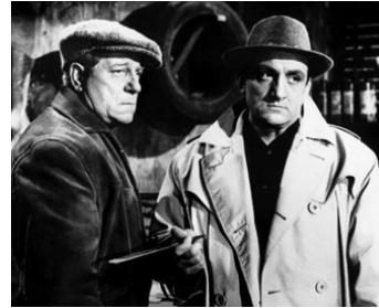
1957 LE ROUGE EST MIS de Gilles Grangier avec Jean Gabin