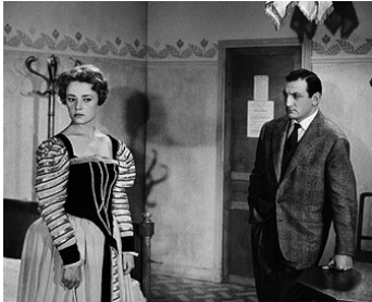
1957 TROIS JOURS À VIVRE de Gilles Grangier avec Jeanne Moreau