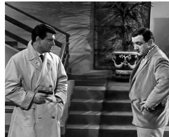
1958 SURSIS POUR UN VIVANT de Luc Mérenda avec Henri Vidal