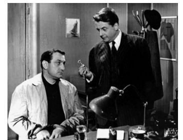
1959 125 RUE MONTMARTRE de Gilles Grangier avec Jean Dessailly