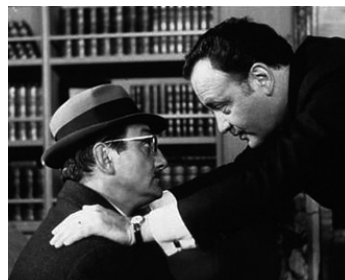
1966 LE DEUXIÈME SOUFFLE de Jean-Pierre Melville avec Raymond Pellegrin