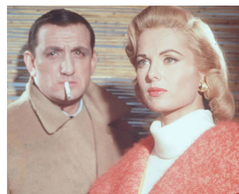
1959 LES MYSTÈRES D'ANGKOR (Herrin der Welt) de William Dieterle avec Martha Hyer