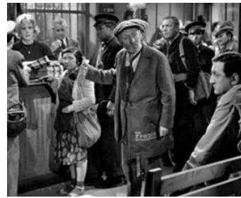
1955 LA LOI DES RUES de Ralph Habib avec Lucien Raimbourg