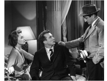
1957 L'ÉTRANGE MONSIEUR STEVE de Raymond Bailly avec Jeanne Moreau, Philippe Lemaire