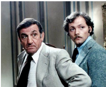
1978 ADIEU, POULET de Pierre Granier-Deferre avec Patrick Dewaere