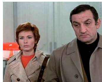
1969 DERNIER DOMICILE CONNU de José Giovanni avec Marlène Jobert