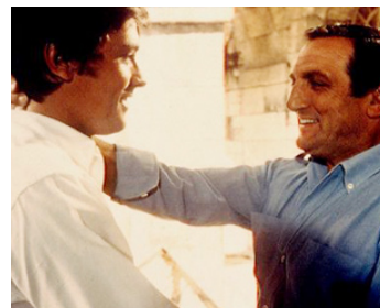
1967 LES AVENTURIERS de Robert Enrico avec Alain Delon