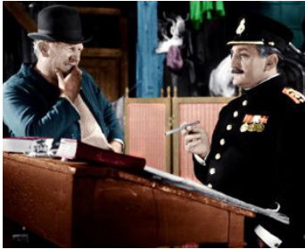
1962 L'OPÉRA DE QUAT'SOUS (Die dreigroschenoper) de Wolfgang Staudte avec Gert Frobbe