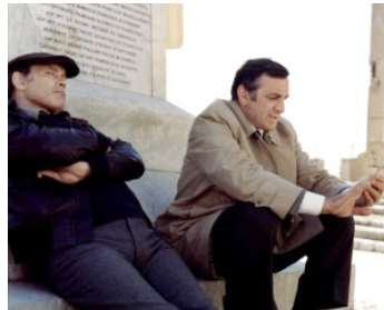
1976 CADAVRES EXQUIS (Cadaveri eccellenti) de Francesco Rosi avec Marcel Bozzuffi