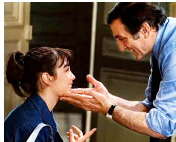
1974 LA GIFLE de Claude Pinoteau avec Isabelle Adjani