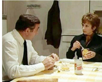
1972 LE SILENCIEUX de Claude Pinoteau avec Suzanne Flon