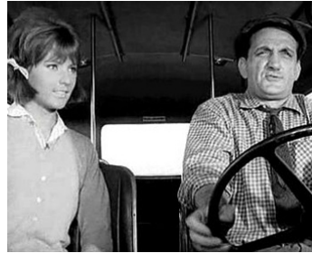
1962 LES PETITS MATINS de Jacqueline Audry avec Agathe Aëms