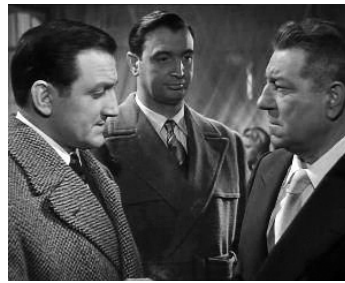
1955 RAZZIA SUR LA CHNOUF d'Henri Decoin avec Albert Rémy, Jean Gabin