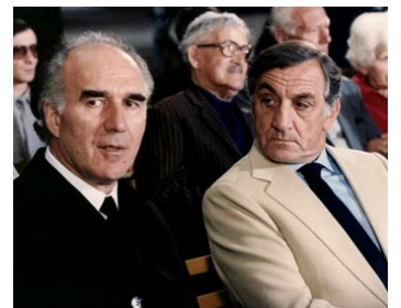
1981 ESPION, LÈVE-TOI d'Yves Boisset avec Michel Piccoli