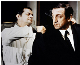
1969 L'ARMÉE DES OMBRES de Jean-Pierre Melville avec Serge Reggiani