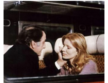
1978 UN PAILLON SUR L'ÉPAULE de Jacques Déray avec Nicole Garcia