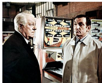
1969 LE CLAN DES SICILIENS d'Henri Verneuil avec Jean Gabin