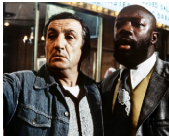
1974 LES DURS (Uomini duri) de Duccio Tessari avec Isaac Hayes