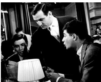
1959 LE CHEMIN DES ÉCOLIERS de Michel Boisrond avec Alain Delon, J-C. Brialy