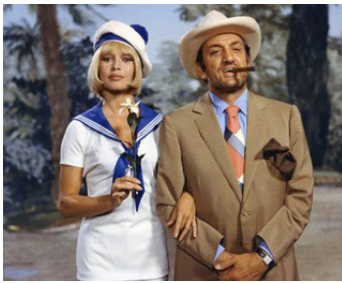
1971 BOULEVARD DU RHUM de Robert Enrico avec Brigitte Bardot