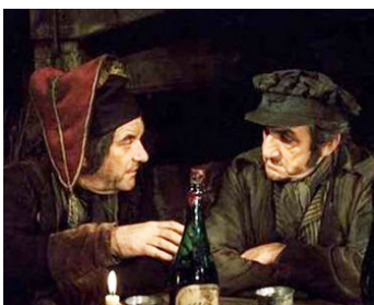
1982 LES MISÉRABLES de Robert Hossein avec Jean Carmet