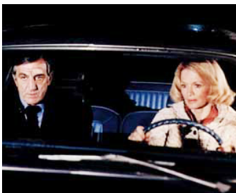
1978 L'HOMME EN COLÈRE de Claude Pinoteau avec Angie Dickinson