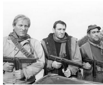
1961 LE ROI DES TRUANDS (Il Re di poggioreale) de Duilio Coletti avec Salvo Randone