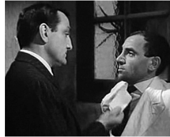
1962 LE DIABLE ET LES 10 COMMANDEMENTS de Julien Duvivier avec Charles Aznavour