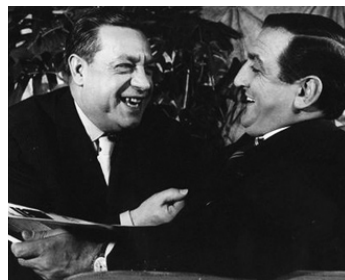
1958 MARIE-OCTOBRE de Julien Duvivier avec Paul Frankeur