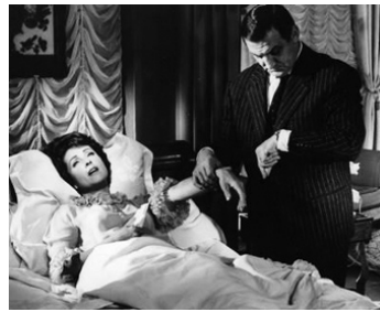
1961 LES LIONS SONT LÂCHÉS d'Henri Verneuil avec Danielle Darrieux