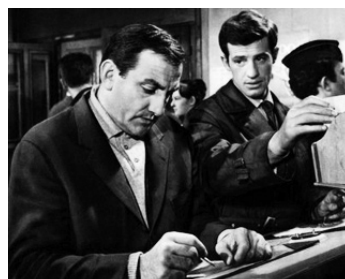
1959 CLASSE TOUS RISQUES de Claude Sautet avec Jean-Paul Belmondo