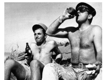
1960 UN TAXI POUR TOBROUK de Denys de La Pâtelière avec Charles Aznavour